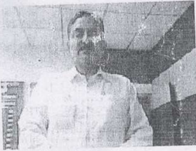
पट्टा देने वाला