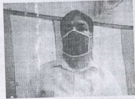
उप/सयुंक्त पंजीयन अधिकारी