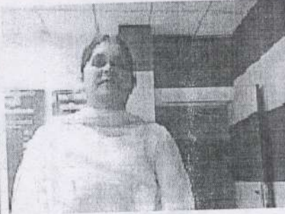
पट्टा लेने वाला